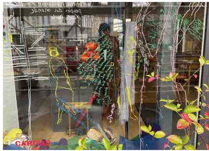
Atelier à LARC «Ma ville, notre ville!»