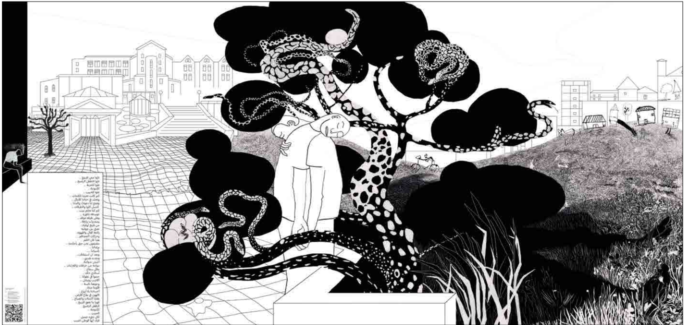
Affiche Place Faubourg des Capucins 30 © Collectif RU