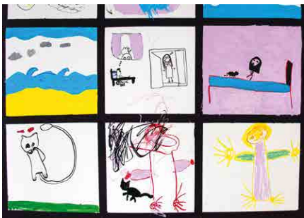
Atelier avec Espace-Jeunes durant Les Eléphantaisies 2023