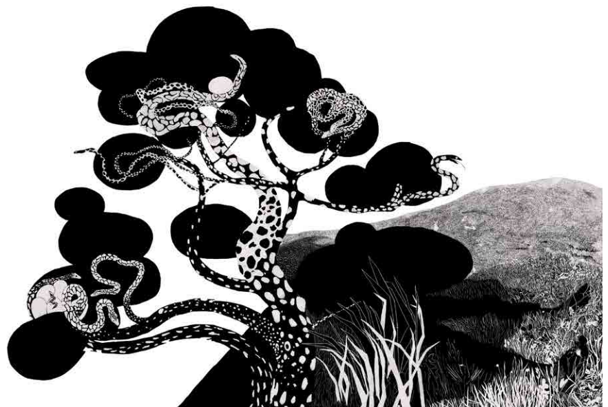
Œuvre à l'encre de chine de Maeva Rubli et Hanna Schiesser pour l'affiche au Faubourg des Capucins 30 © Hanna Schiesser et Maeva Rubli