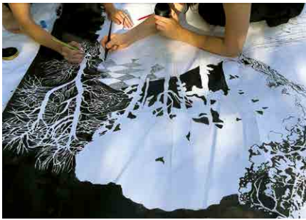
création à l'encre de chine, Hanna Schiesser et Maeva Rubli