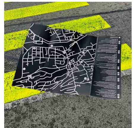
Carte «Près de tes paupières» © Hanna Schiesser et Maeva Rubli

Télécharger les images du dossier de presse