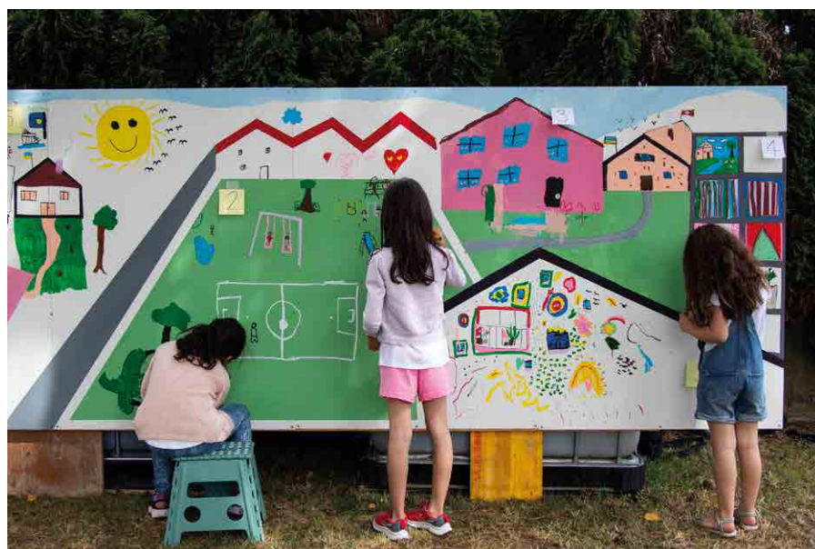
Atelier avec Espace-Jeunes durant Les Eléphantaisies 2023

Ces rencontres ont donné lieu à de riches échanges (d'expériences personnelles) qui ont nourri et enrichi le processus créatif du projet.