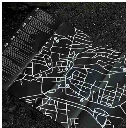
Carte «Près de tes paupières» © Hanna Schiesser et Maeva Rubli