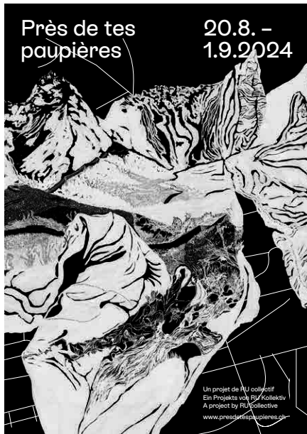
Affiche de l'exposition «Près de tes paupières»