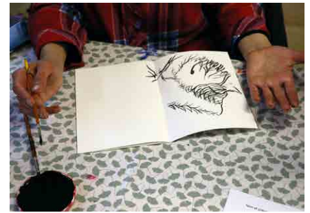
Atelier à LARC «Les lignes de ta paume»